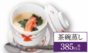
茶碗蒸し 385円 税込