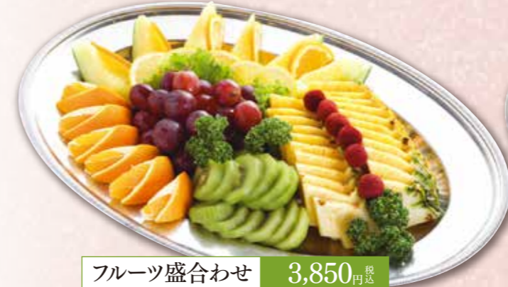
フルーツ盛合わせ 3,850円 税込