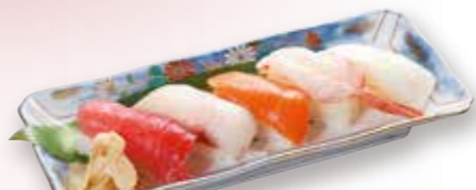
握り寿司5貫 880円 税込