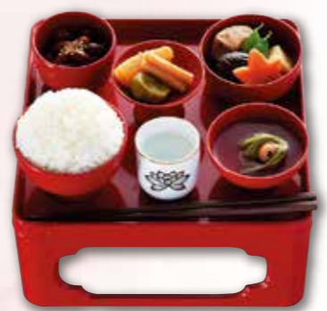
霊供膳 1,650円 税込