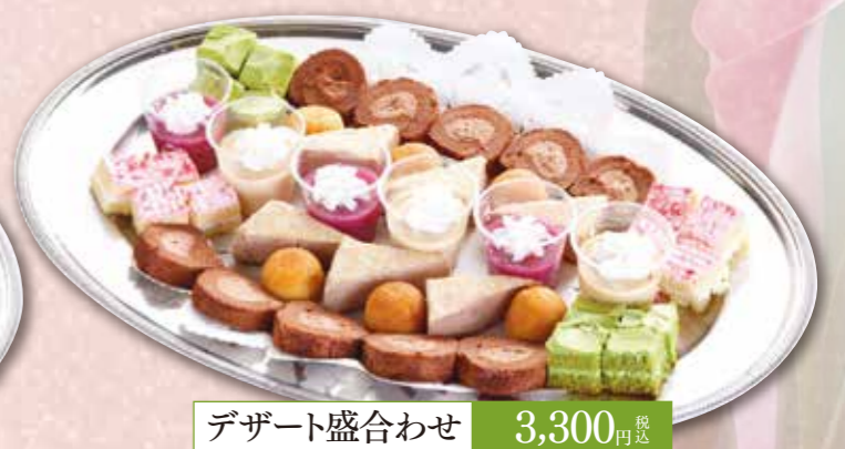
デザート盛合わせ 3,300円 税込

ご法要お料理各種取り揃えております。お寺・ご自宅法要の仕出し各種承っております。