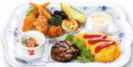
お子様ランチ 2,200円 税込