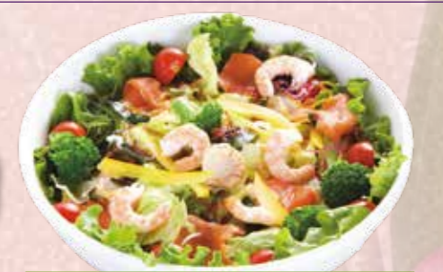
サラダ盛合わせ 3,300円 税込