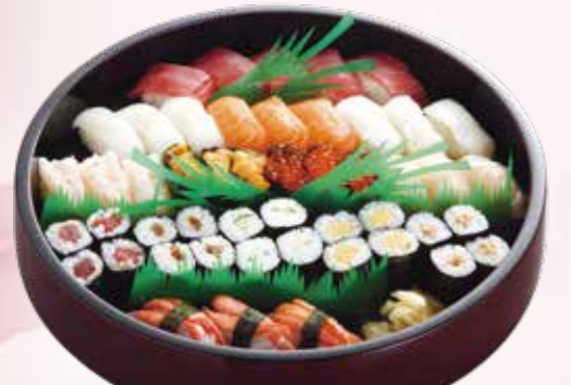
生巻寿司 6,600円 税込