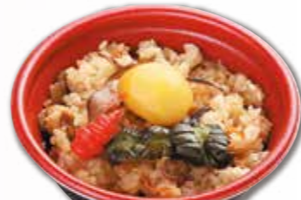
炊込み御飯 495円 税込