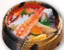
ちらし寿司 660円 税込