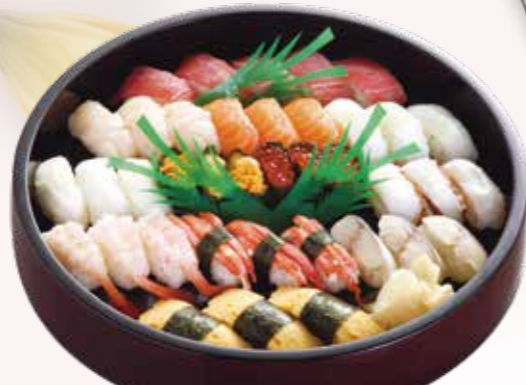
生寿司 6,600円 税込