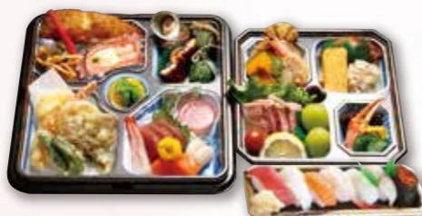
折詰+にぎり寿司7貫 8,800円 税込