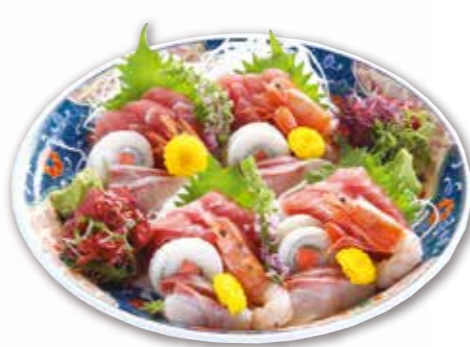
刺身盛合せ 5,500円 税込