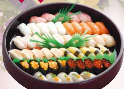
生寿司 11,000円 税込