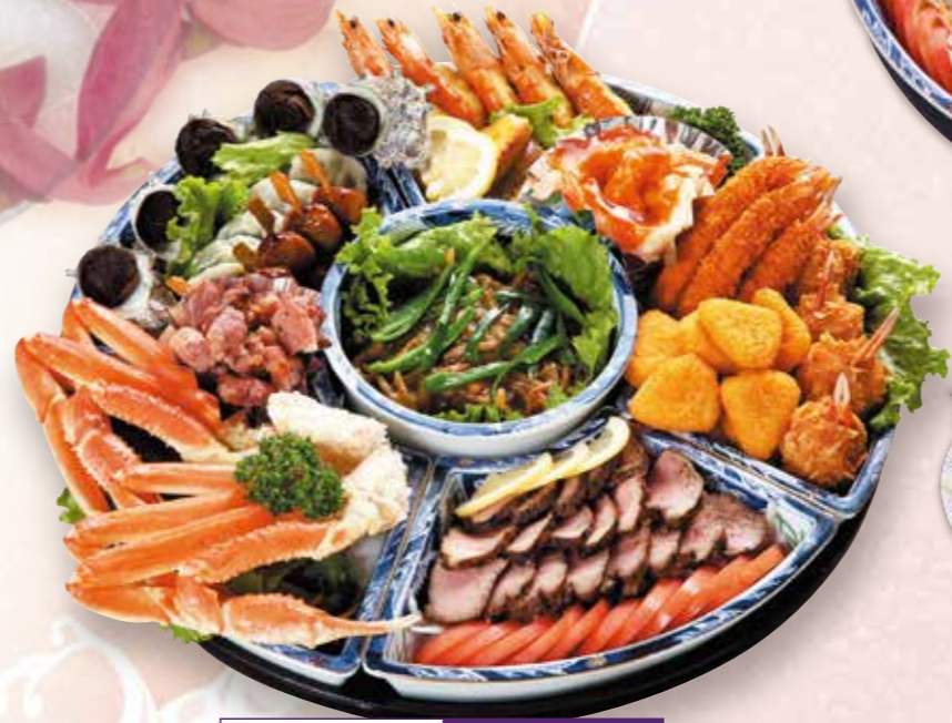
オードブル 11,000円 税込