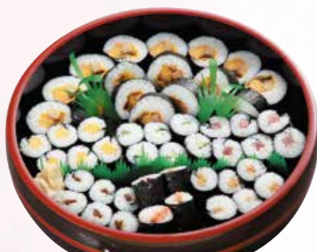
巻寿司 3,300円 税込