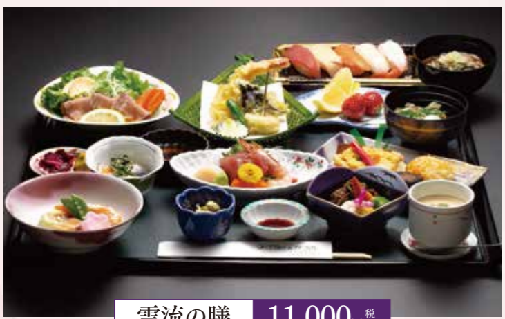
雲流の膳 11,000円 税込