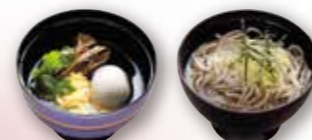
吸い物 385円 税込