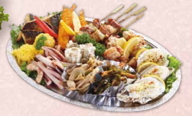
オードブル 4,400円 税込