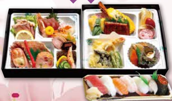
折詰+にぎり寿司7貫 11,000円 税込