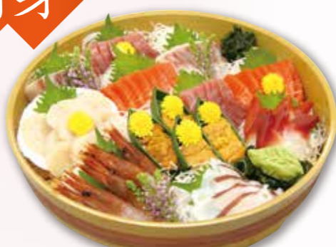
刺身盛合せ 6,600円 税込