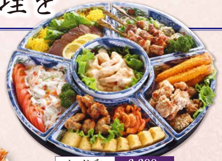
オードブル 6,600円 税込