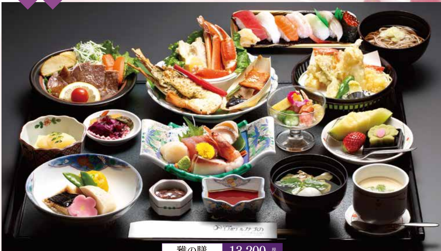
雅の膳 13,200円 税込