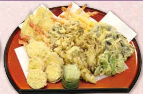
天ぷら盛合わせ 3,300円 税込