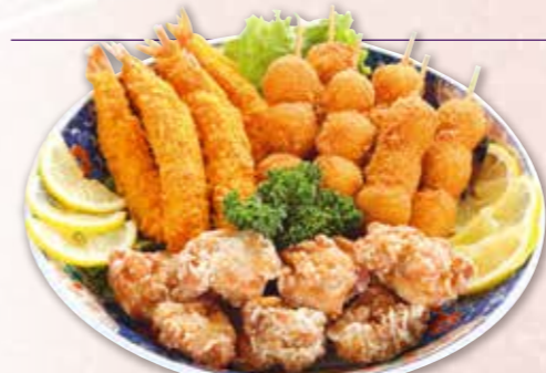
揚物盛合わせ 3,300円 税込