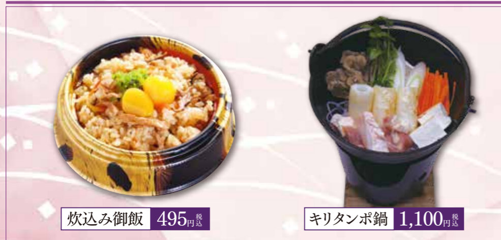
炊込み御飯 495円 税込