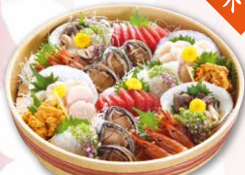
刺身盛合せ 11,000円 税込