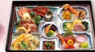
折詰 6,600円 税込